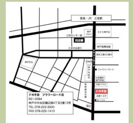
ドキ手芸 神戸市中央区磯辺通4丁目2番13号 フラワーロード東側歩道（そごう側）を 三宮駅から南へ約600m（徒歩10分） 東遊園地公園向い