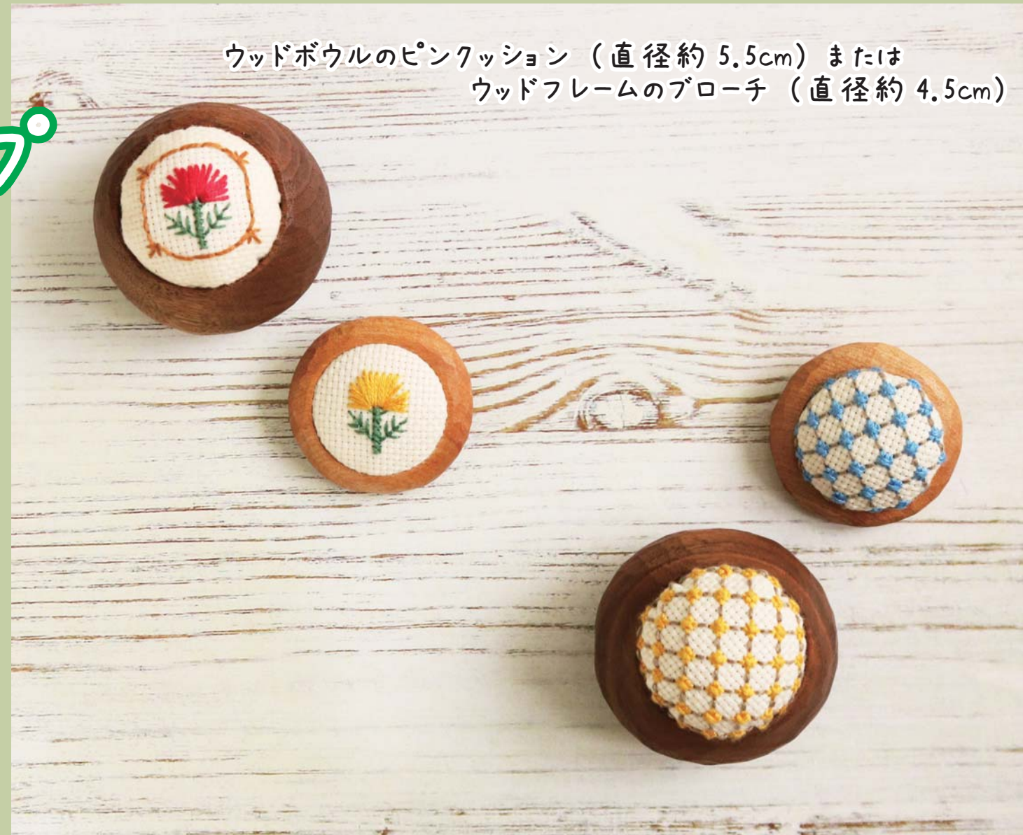
ウッドボウルのピンクッション（直径約5.5cm）または ウッドフレームのブローチ（直径約4.5cm）