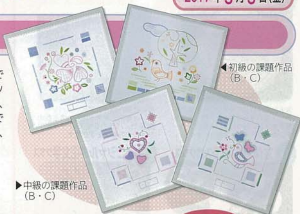
初級の課題作品 (B・C)

初級または中級資格課題作品(初級・中級のBまたはC作品)を全10回・月2回の5ヶ月間で学ぶクラスです。ご自宅でもしっかり予習・復習をしていただける『初級・中級資格合格ガイドブック』をテキストとし、刺しゅう布の基礎から正しいステッチの刺し方、ポイントをしっかりと学び、短期間で資格取得を目指します。図案は2010年より追加された新図案BまたはCよりお好みでお選び下さい。また、使用する刺しゅう布は100番(麻)または8000番(綿)と従来通りですが、図案を転写し、ふちをレース処理した便利な布もご用意していますので、ぜひご活用下さい。