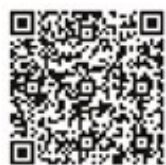
●戸塚刺しゅう研究所 オンラインショップ 会員登録のご案内

新しいオンラインショップでの会員登録がスタートしています。会員情報登録画面へお進みいただき、戸塚刺しゅう協会の会員様は会員IDの入力欄へ会員番号6桁をご入力ください。一般の方は好きなIDを半角英数字でご入力ください。尚、戸塚刺しゅう協会の会員様、及び一般の方もオンラインショップの会員登録をさせていただくと、メールでお得な情報などショップのお知らせをお送りする予定ですので、ぜひ登録をよろしくお願い致します。注意：戸塚刺しゅう協会会員様で既に戸塚刺しゅう協会会員番号以外でのオンラインショップ会員登録をお済ませの方は、大変お手数ではございますが再度新規で会員IDが会員番号6桁の会員登録をしていただきますようお願い申し上げます。(一度ご登録いただきました会員IDは変更することができないため、再度新規登録していただく必要がございます。)