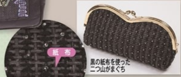
黒の紙布を使った 二つ山がまぐち